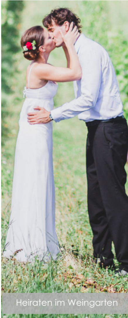
Heiraten im Weingarten

Nicht nur die romantische Kulisse des Hauses, sondern auch die malerischen Weingärten und Kirchen von Gumpoldskirchen sind der ideale Rahmen für einen unvergesslichen Hochzeitstag.