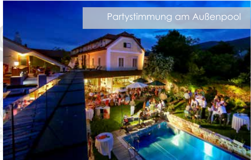
Partystimmung am Außenpool